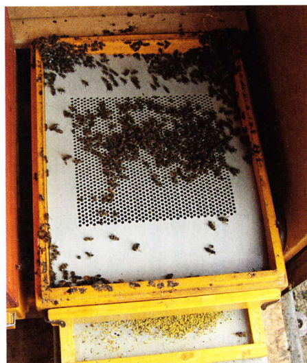
Vše je řešeno účelně a jednoduše. Tak jako vkládání pylochyty. Vrtaná deska se zasune do dna, včely jí musí odteďka prolézat, a je hotovo.

je ideální pro léčení kyselinou mravenčí podmetem a vůbec i ostatními léčivy či vyhrazenými léčivými přípravky. Tento způsob aplikace je sice podle literatury o něco méně účinný, a to zejména u dlouhodobých odpařovačů (ty nepoužívám, takže se musím přiklonit k literatuře). Při mé aplikaci Formidolu tzv. „naráz“ (vkládám totiž do podmetu odparné desky s kyselinou mravenčí zcela bez jakéhokoliv regulačního