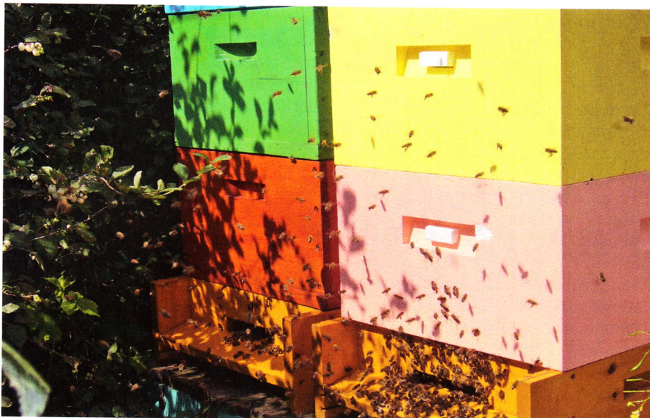
Dno je základem úlu ve skutečném i přeneseném významu. Jeho konstrukcí, která byla vyvíjena několik let, lze částečně ovlivnit chování včelstva.