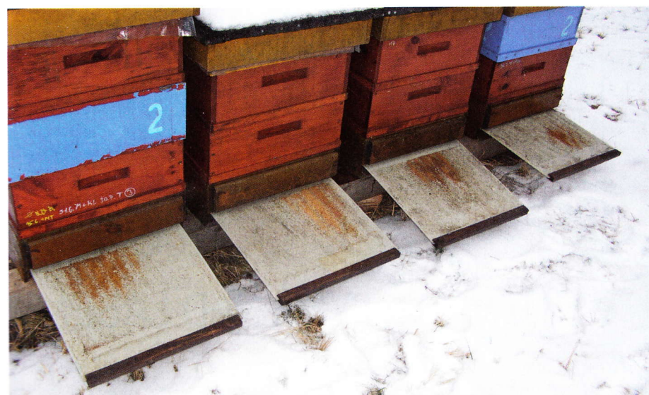
Kontrola zimní měli snadno a rychle

Při dnešní nabídce úlových sestav není snadné si vybrat v čem včelařit. Nicméně z mé dlouholeté včelařské praxe (na které jsem existenčně závislý, neboť je to moje povolání) vyplývá, že pokud chci dosahovat vysokých medných výnosů s minimalizační časů, je otázka konstrukce dna úlu jednou z klíčových prvků. Dno je základem úlu a je třeba jej využívat k intenzivnímu ovlivňování včelstva. Musí splňovat nároky včel, být co nejvíce přátelské jejich přirozeným životním podmínkám, ale zároveň musí co nejvíce usnadňovat práci včelařů. Myslím si, že po létech vývoje a praktického ověřování jsem se do těchto požadavků střelil. Dno splňuje definici varroadna (může se na něj čerpat dotace z EU), které doporučuji k nákupu využít.