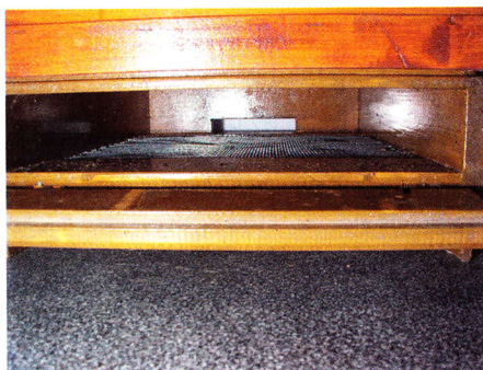
Dno je ze zadu opatřeno dvířky pro snadné čištění a léčení, příp. krmení, bez rušení včel.