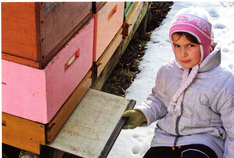
V zimě každá ruka dobrá

je ideální pro léčení kyselinou mravenčí podmetem a vůbec i ostatními léčivy či vyhrazenými léčivými přípravky. Tento způsob aplikace je sice podle literatury o něco méně účinný, a to zejména u dlouhodobých odpařovačů (ty nepoužívám, takže se musím přiklonit k literatuře). Při mé aplikaci Formidolu tzv. „naráz“ (vkládám totiž do podmetu odparné desky s kyselinou mravenčí zcela bez jakéhokoliv regulačního