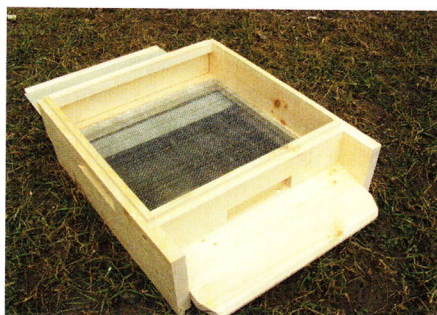
Pohled na celozasíťované dno s „dírovým“ česnem a velkým letákem. Obojí usnadňuje včelám přistávání zejména v době snůšky.

nikoliv šířka jim pak pomáhá usnadnit provoz na česně v době maximální snůšky. U úlů stojících v jedné řadě vedle sebe tím pádem nevzniká jeden dlouhý otvor, tak jako u česna, které ho mají přes celou šířku dna. Tím pádem mám daleko menší zalétávání, zlepšuje se oplození matek (u úlů v řadě však není nikdy ideální), a pozoruji i lepší zdravotní stav včelstev. Včele nevyhovují naše „řadové“ chovy (úly umístěné v jedné řadě těsně vedle sebe). Zkrátka čím je větší vzdálenost česna (= dír do úlu), tím mají včely větší „soukromí“. Potvrzení méj teorie jsem pak s potěšením nalezl v knize Fenomenální včely, za jejíž překlad co nejuctivěji děkuji příteli Ing. D. Titěrovi. Dno je opatřeno mírným přesahem bočnic dolů (falcem). Falce zároveň tvoří „nožky“ a krom toho jsou díky nim dna štosovatelná. Vzadu je dno osazeno otevíratelnými dvířky, jimiž lze pozorovat spodní část úlu, vkládat léčiva nebo čistit podmet bez rušení včel. Dále jsem je na bocích opatřil vyfrézovanými úchyty, což usnadňuje uchopení a manipulaci s nimi.